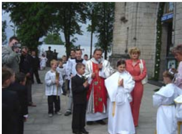
Z życia parafii św. Mikołaja w Żarnowie