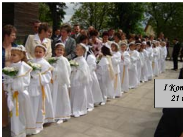
I Komunia Święta 21 maja 2006