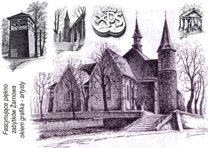
Fascynujące piękno zabytków Żarnowa okiem grafika - artysty